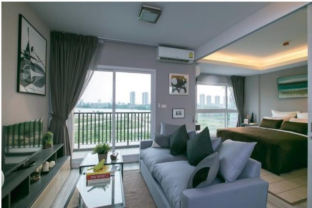
ดับเบิลเลค คอนโดมิเนียม

Home > Promotion > ส่วนลด 650,000* บาท และ ฟรี ค่าส่วนกลาง 60 เดือน ที่ ดับเบิลเลค