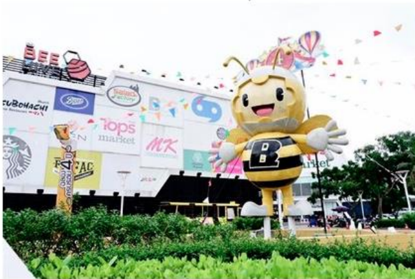
รูปทั้งหมด

ข่าวบันเทิง ThaiPR.net -- จันทรที่ 29 ตุลาคม 2561 10:06:36 u.