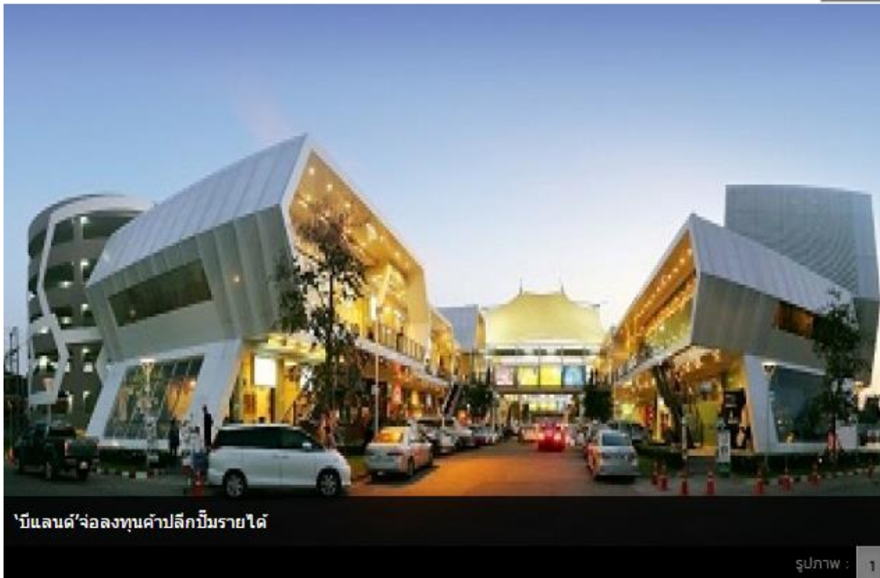
'บีแลนด์'จ่อลงทุนค้าปลีกปีมรายได้